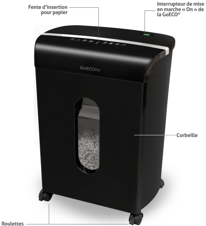
schéma de la déchiqueteuse